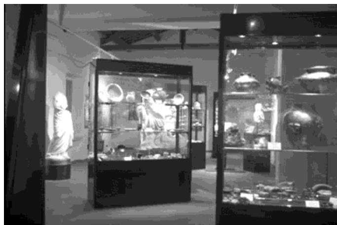
Alcuni dei reperti conservati nell'Antiquarium comunale

tre avrebbero di sicuro entusiasticamente accettato, sottoscritto e condiviso la soluzione localizzativa adottata. Secondo la loro cultura tradizionale, nei