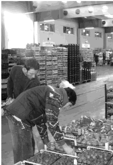
Preparativi per il secondo forum "Orto delle delizie" con grossisti e ristoratori Nella foto l'interno del mercato

Si chiama "Orto delle Delizie" il forum di incontri d'affari tra grossisti del Car e manager del settore horeca (hotel, restaurant, catering) che - non ancora giunto alla seconda edizione dopo il buon esordio del maggio scorso presso la Fiera di Roma in occasione di Cibus 2007 - è già considerato un punto di riferimento strategico dagli imprenditori dell'accoglienza e della ristorazione, che hanno o cercano un ruolo da protagonisti sulla ribalta professionale. Ai manager ed ai buyer di questo comparto - almeno a quelli più attenti alla freschezza, alla qualità, alla genuinità ed alla convenienza delle materie prime da scegliere per l'attività che esercitano - i grossisti del Centro Agroalimentare di Roma e la società di gestione Cargest sono pronti a mostrare nell'Orto delle delizie i loro prodotti di classe A e il top-level dei loro servizi all'impresa. E chi non è ancora attrezzato per rispondere nei termini organizzativi più adeguati all'imminente domanda professionale di nuovi sapori allettanti, di una illimitata ampiezza di scelte, di salutaris freschezze alimentari, di aromi tradizio-