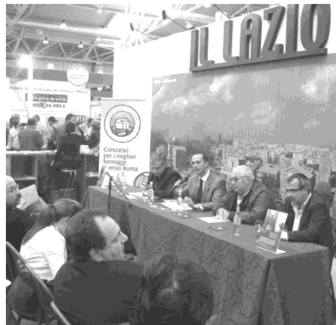
Un momento della rassegna Cibus 2007