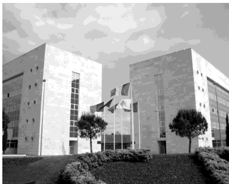
Al Centro Agroalimentare di Guidonia si possono trovare gli inconfondibili profumi di fragole nostrane